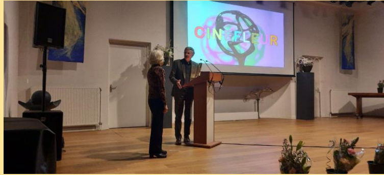
Foto verslag Cinefleur 2024